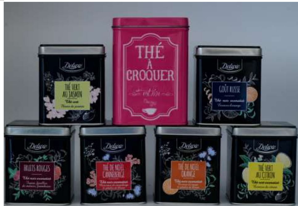
Boite à lumière