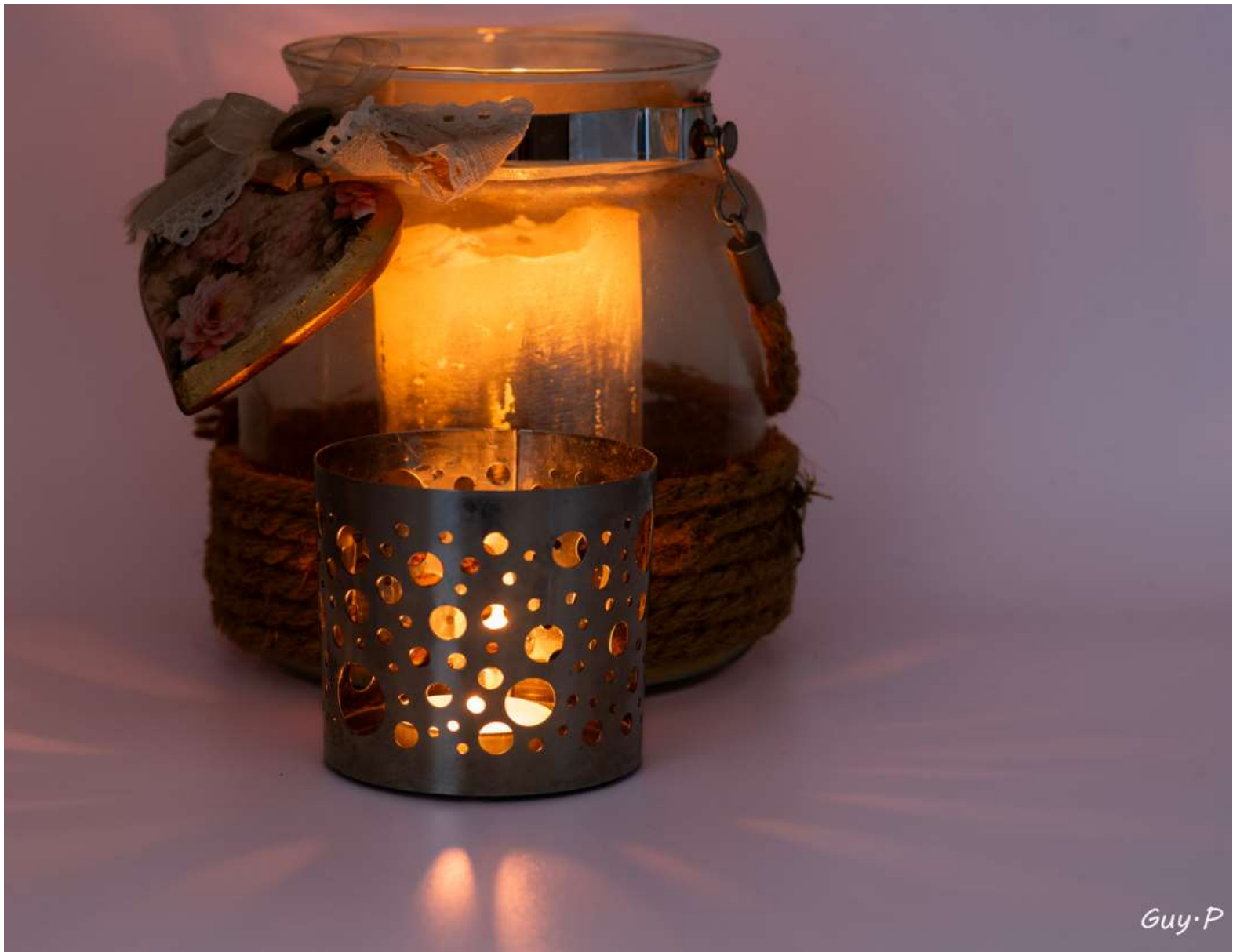
Les 2 bougeoirs sont éclairés à l'intérieur par des lampes leds miniatures