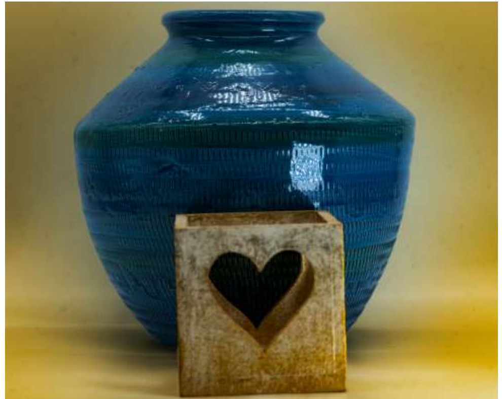
Papier kraft au fond