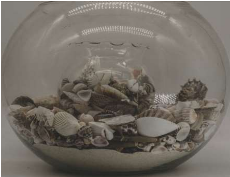
Éclairage par le haut